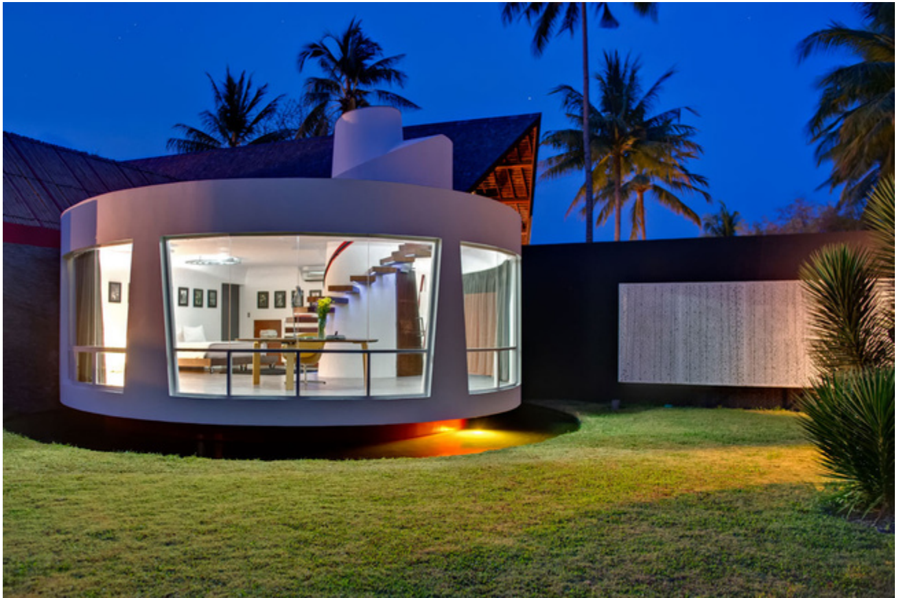
14 de 16 — Villa Sapi (Indonesia): Diseño futurista en Indonesia

Foto: Villa Sapi. Texto: Almudena Martín — Villa Sapi es una obra maestra del diseño futurista situada en la tranquila isla de Lombok , en Indonesia. Una casa tropical rodeada de un bosque de cocoteros y decorada con muebles color negro, rojo y lima con paredes llenas de bambú y obras conceptuales. Una villa sorprendente que no tiene límites visuales , ya que está concebida para tener grandes vistas desde sus cinco dormitorios, sala de estar, cocina, etc. Precios según temporada.